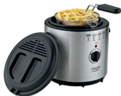
DEEP FRYER AD 4905