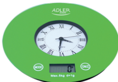
KITCHEN SCALE AD 3144