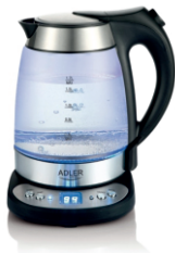
ELECTRIC KETTLE AD 1247