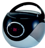
BOOMBOX RADIO AD 1125