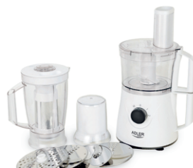
MULTI ROBOT AD 4055