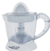
CITRUS JUICER AD 4003