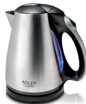
ELECTRIC KETTLE AD1238