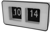
Auto-flip clock CR 1131