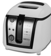
Deep fryer CR 4907