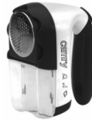
Lint remover CR 9606