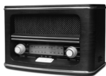
Retro radio CR 1103