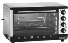
Electric oven CR 111