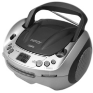
CD/MP3 player (boombox) CR 1123