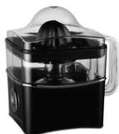
Citrus juicer CR 4001