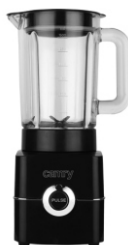
Blender CR 4050