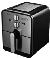
Air fryer CR 6306