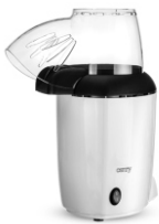
Popcorn maker CR 4458