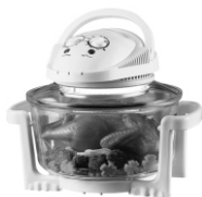
Halogen oven CR 6305