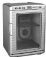
Mini-fridge CR 8062