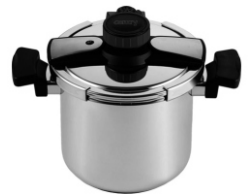
Pressure cooker CR 6726