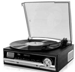
Turntable with radio CR 1113