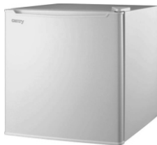
Aggregate refrigerator CR 8064