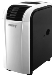
Air conditioner CR 7902