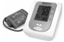
Arm blood pressure monitor CR 8409