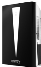
Air dehumidifier CR 7903