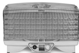
Food dryer CR 6653