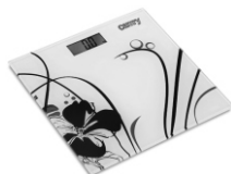
Electronical bathroom scale CR 8118