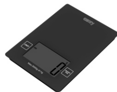
Electronic kitchen scale CR 3149