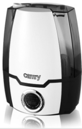
Air humidifier CR 7952