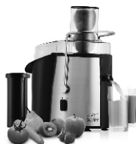
Juice extractor CR 110