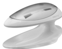
Manicure set CR 2151